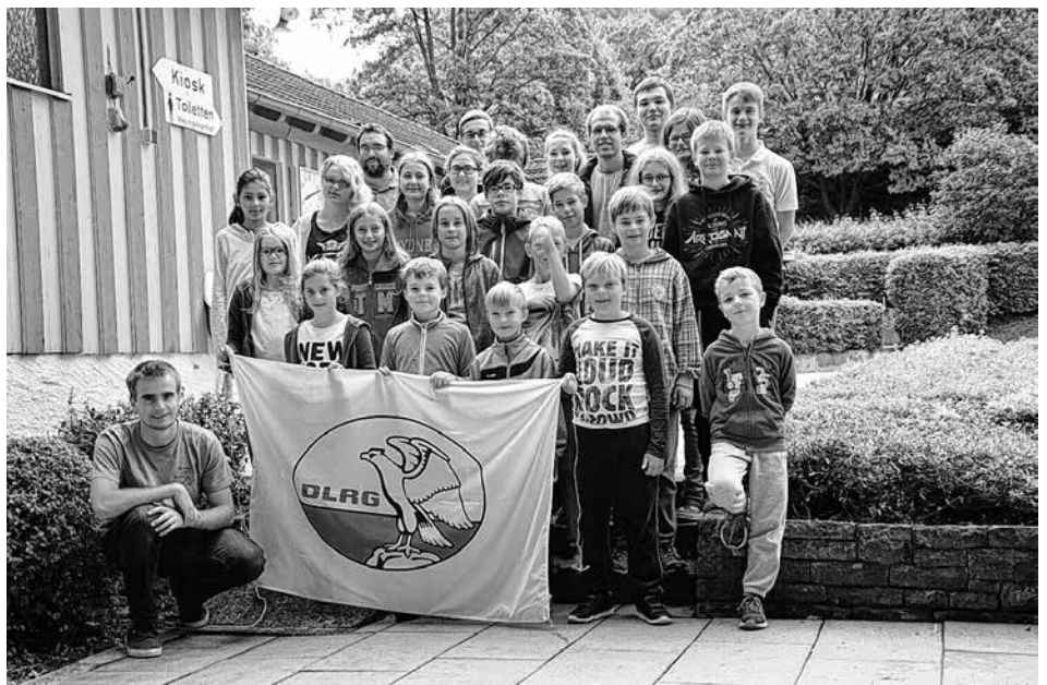
16 Kinder und die DLRG-Betreuer bei der Freibadübernachtung im Rahmen des Sommerferienprogramms

Wir Trainer freuen uns auf viele DLRG-Neueinsteiger! :-)