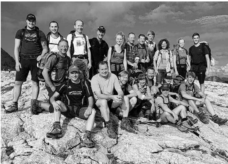
Die Teilnehmer auf dem Steinernen Meer

Unsere 2. Herrenmannschaft konnte im ersten Spiel mit erfolgreich in die Hinrunde starten. Obwohl die Nr. 1 Schall fehlte, reichte es nach über 3,5 Stunden doch zum 9:7-Sieg. Zuvor ging es in den Spielen hin und her. Aus den Doppel kamen anfangs 2 Zähler durch Gaiser/Borst gegen Timmreck/Reschl mit 3:2 sowie durch Schäffer/Münzinger gegen Blon/Kraft mit 3:0 Sätzen. In den Einzeln waren für Neuffen erfolgreich: Schroth im vorderen Paarkreuz mit 2 Siegen gegen Timmreck und Blon jeweils in 3:2 Sätzen. In der Mitte konnte Münzinger gegen Kraft mit 3:0 gewinnen. Im hinteren Paarkreuz war Borst gegen Reschl (3:0) sowie Molter (3:0) erfolgreich. Ebenfalls siegreich war hinten unser Ersatzmann Schmidt gegen Molter mit 3:1 Sätzen. Schäffer und Gaiser gingen an diesem Tag in den Einzeln leer aus. Vor dem Schlussspiel