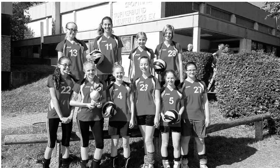
Die erfolgreichen Spielerinnen