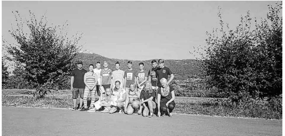
Auf dem Bild die Teilnehmer mit den Betreuern