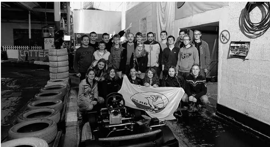
Die RennfahrerInnen der DLRG OG Neuffen-Beuren