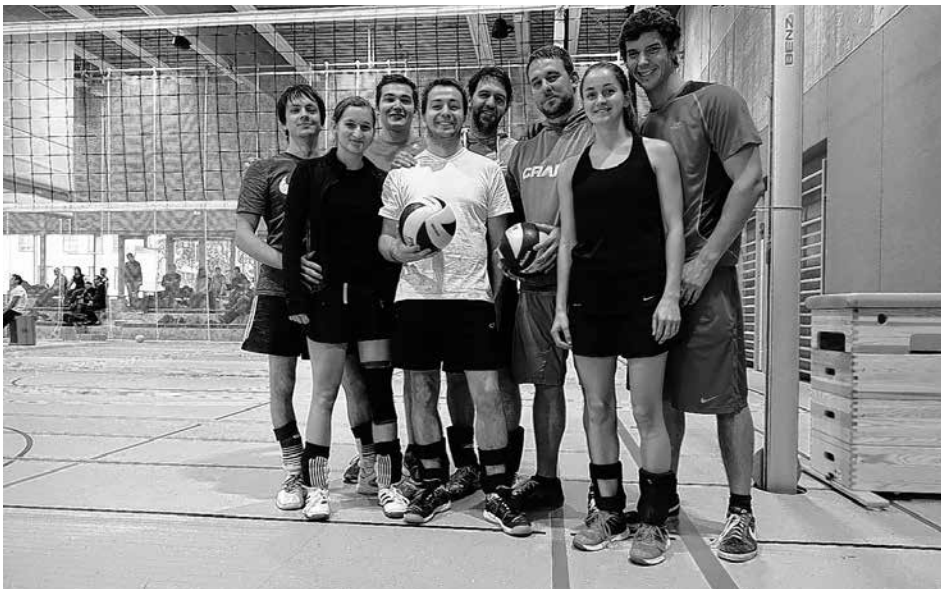
Erfolgreiche Teilnahme am Aichtal-open