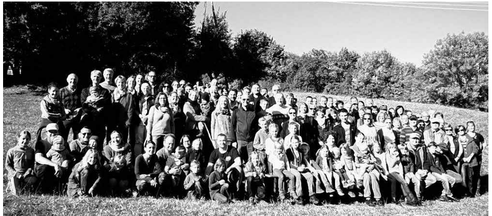
Gruppenfoto am Lettenberg