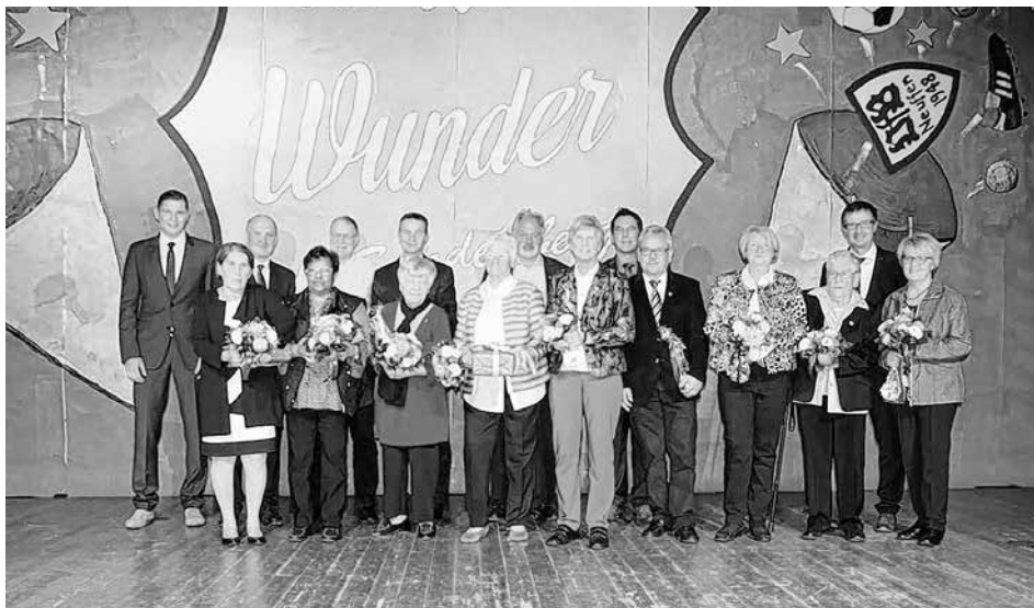
Die Jubilare bei der Jahresfeier des VfB Neuffen

am Donnerstag, 15. Dezember 2016, von 19:30 - 21:00 in Münsingen-Auingen Kurzweilig, spannend, faszinierend und