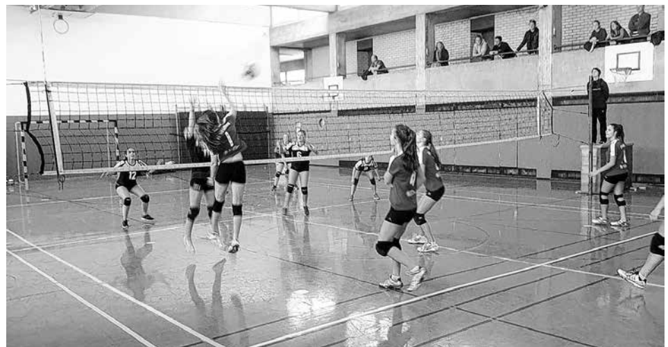
Die Neuffener Mädels in Aktion