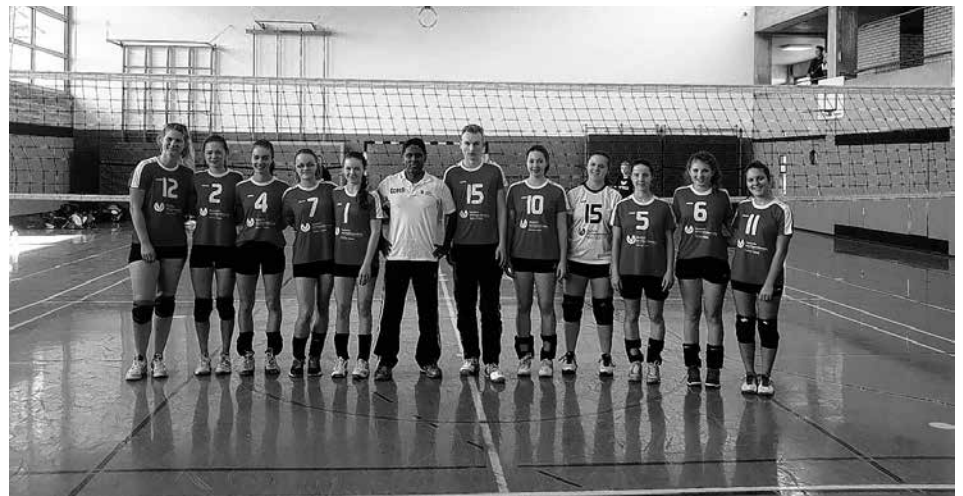
Die glücklichen Sieger

Am vergangenen Wochenende fand der zweite Spieltag der U18-Volleyballer des TBN in Eislingen statt. Die Mannschaft spielte gegen Leinfeldern, G.A. Stuttgart und Ellwangen, konnte einen Sieg holen