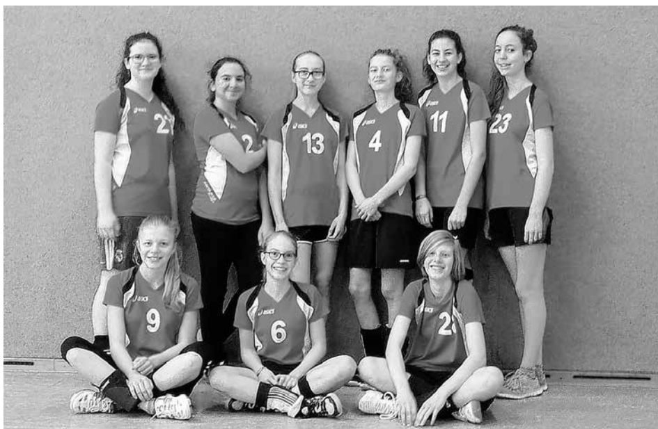
Die glückliche Mannschaft