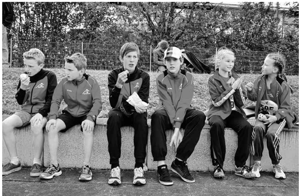
Chillen & Spass in den Pausen