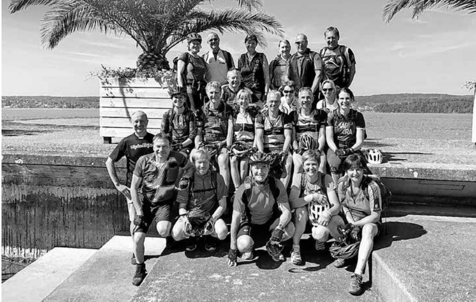
Die Teilnehmer in Überlingen

seine Schwäbischprüfung ablegen. In fast akzentfreiem Schwäbisch artikulierte er: „Mole mol a Mole no“. Nach dem Biosphärengebiet Truppenübungsplatz Münsingen gab es noch eine letzte Kaffeepause im Campingplatz Böhningen, bevor wir dann am Sonntagabend das Spadi erreichten, wo wir die gelungene Pflugstradtour gemütlich ausklingen ließen. Und siehe da, es blieb beide Tage Regen frei. Helmut Meyer