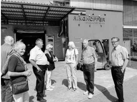
Besuch und Gespräche bei Ringhoffer Verzahnungstechnik in Kohlberg

Termine und Nachrichten der CDU finden Sie auch unter: www.cdu-neuffener-tal.de