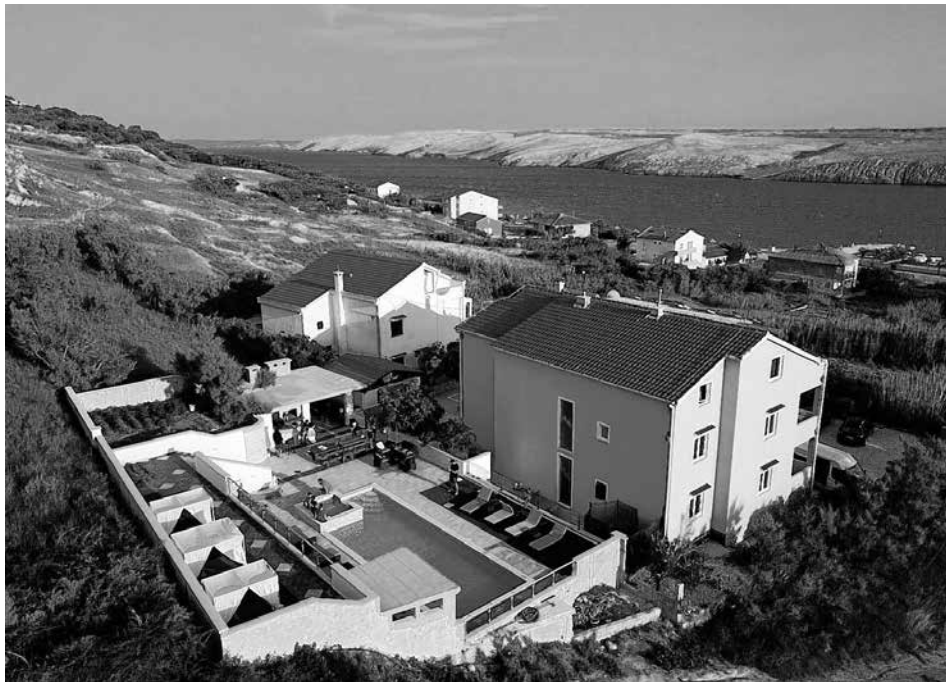
Sommer, Sonne, Strand, Meer und Pool - was braucht ein DLRG'ler mehr?

Musik und Kunst am Sonntag, 2. Juli, 13-17 Uhr, Marktscheune Neuffen