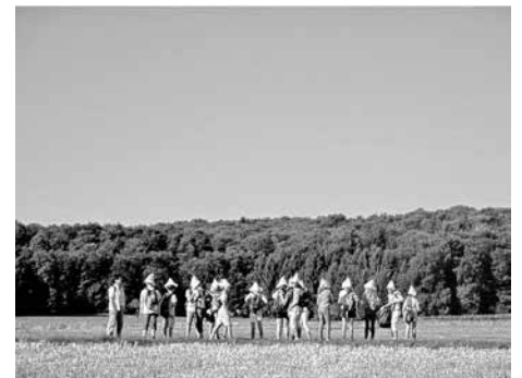
Szenische Forschung zum Figurentheaterstück in der Region Heidengraben.

Alle Bastelfreudigen sind herzlich willkommen!