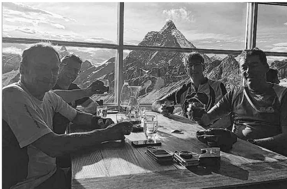
Auf der Theodulhütte mit Hintergrund Matterhorn