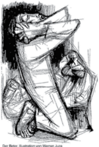
Der Betor, Illustration von Werner Juss