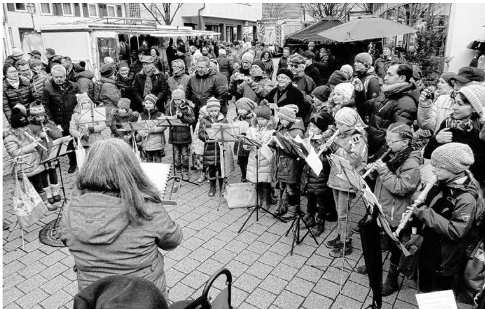
Blockflötenschüler musizieren auf dem Neuffener Weihnachtsmarkt