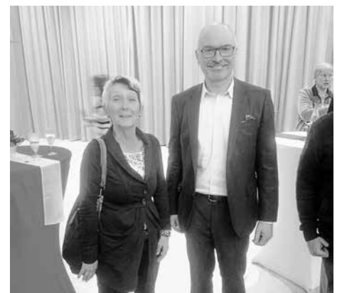
D. Elfert mit MdEP Peter Simon in Frickenhausen

Aus organisatorischen Gründen bitte wir um Anmeldung unter folgendem Link: https://www.spd-bw.de/form/show/1916/