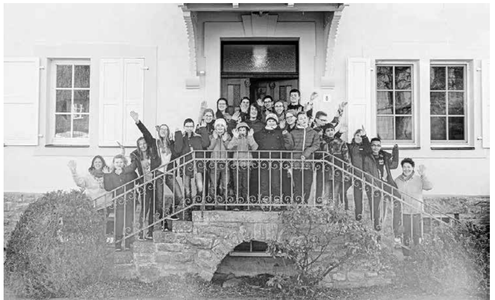
Gruppenbild Miniwochenende Dipbach

Endlich war es wieder soweit. Freitag, der 23. Februar war da! 20 Minis und zwei Betreuer machten sich auf den Weg nach Dipbach um gemeinsam den Spuren ihres Glaubens nachzugehen. Nachdem die Zimmer bezogen waren und alle durch ein tolles Abendessen gestärkt waren, gingen die Minis in Kleingruppen einfachen Lebensfragen auf den Grund.