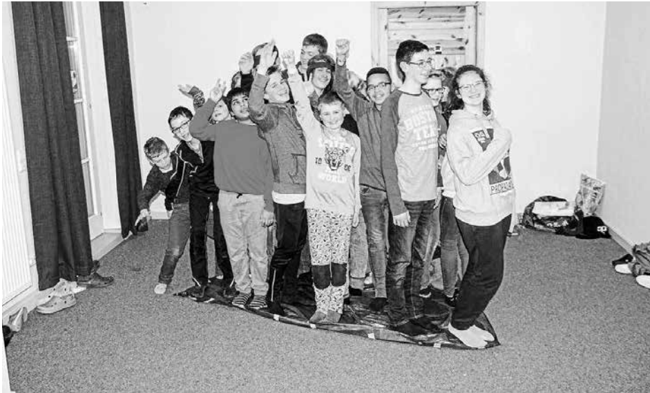
Ministranten beim Spiel auf der Plane

Das machen wir wieder – FKF – Minis aus Neuffen, Beuren und Kohlberg, Profis in jeder Lage!