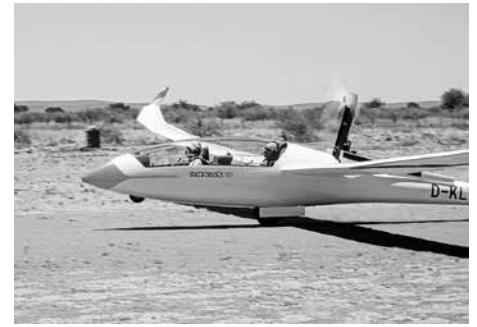
Start mit dem Arcus M