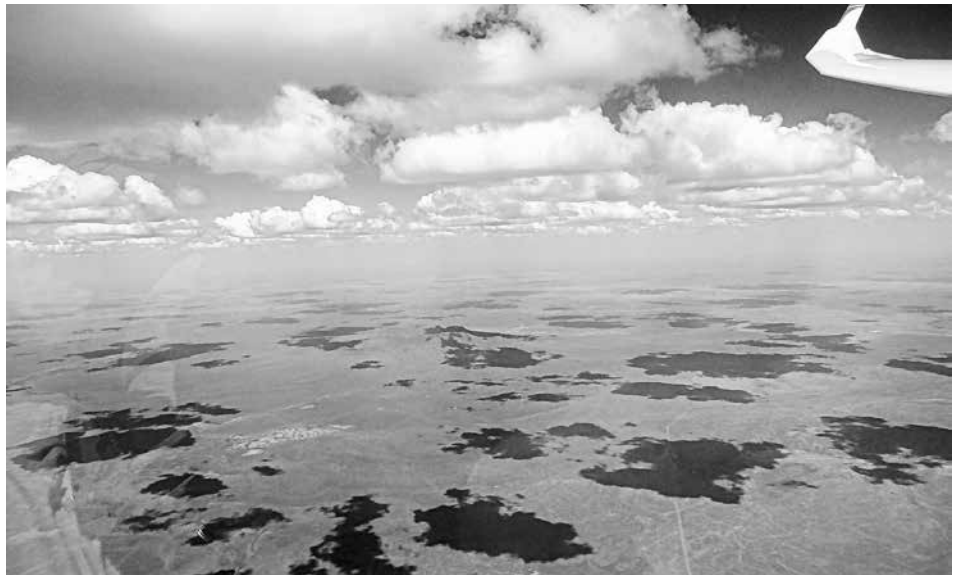
Über der Kalahariwüste in ca. 4500m Höhe