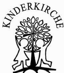
St. Michael & St. Paulus Gemeinsam Leben, Glauben, Wachsen.