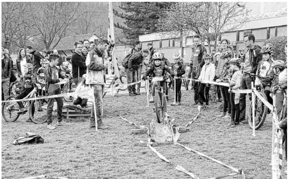
Draussen wurde der Trial ausgerichtet