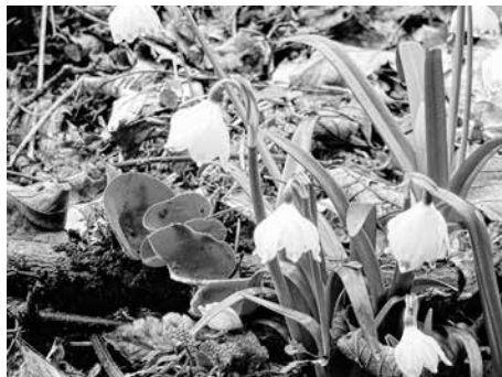
Zinnoberroter Kelchbecherling und Märzenbecher

Am Parkplatz angekommen waren sich die Teilnehmer sofort einig, diesen schönen Wandertag bei einer Tasse Kaffee und einem leckeren Kuchen auf Schloß Mochental ausklingen zu lassen.