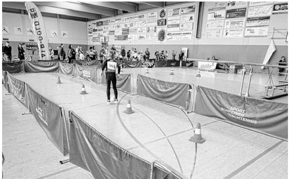
Der Athletiktest fand in der Halle statt

Ein herzliches Dankeschön gebührt allen Helfern, die mal wieder unglaubliches geleistet haben, damit der Tag so rund läuft! Vielen Dank!