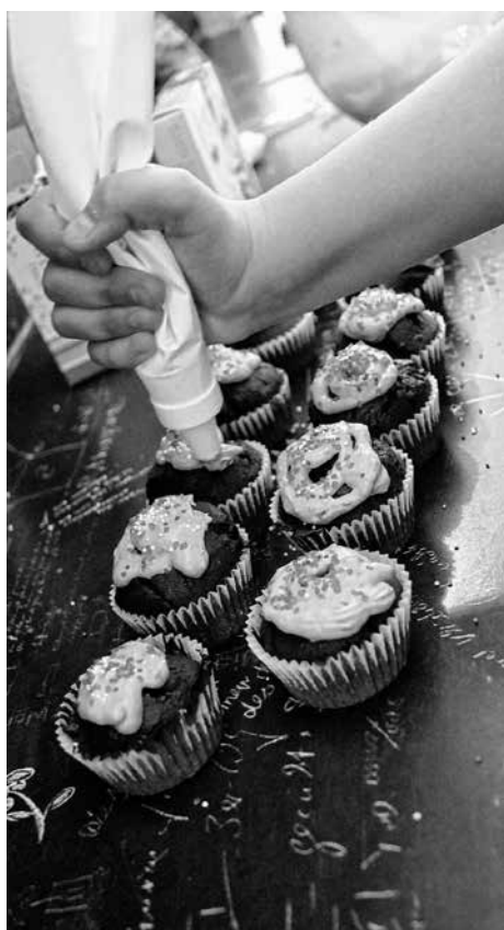
Die Mädchen verzieren Cupcakes

Über das Projekt „Activity Guides“ fand am Mittwoch, den 21. März, bereits das zweite Mädchenangebot für Teilnehmerinnen im Durchschnittsalter von 12 Jahren statt. In Kooperation mit dem Jugendcafé Frickenhausen konnten die Mädchen unterschiedlicher Herkünfte am ersten Nachmittag (7. März) zwei verschiedene Cupcakes backen, wozu selbstverständlich das Verzieren sowie Verzehren gehörte. Außerdem gab es die Gelegenheit die regulären Angebote des Jugendcafés zu nutzen, wie beispielsweise das Spielen von „Just Dance“ an