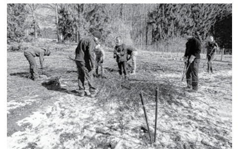
Krähle-Aktion in Böhringen

Wissenswerte Informationen rund um die Ortsgruppe, aktuelle und archivierte Berichte sowie Bilder von Aktivitäten, Termine und Ansprechpartner finden Sie auf unserer Homepage unter www.neuffen-beuren.dlrg.de