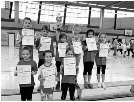
Das überlegene U10er Team