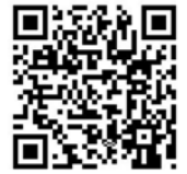
QR-Code Meine Umwelt-App

Weitere Informationen zur Asiatischen Hornisse und wie sich die Art von heimischen Insekten unterscheiden lässt finden sich auf der Homepage der LUBW https://www.lubw.baden-wuerttemberg.de/natur-und-landschaft/asiatische-hornisse sowie auf der Homepage der Landesanstalt für Bienenkunde der Universität Hohenheim unter https://bienenkunde.uni-hohenheim.de/vespavelutina . Dort finden sich auch weitere Informationen, wie Bürgerinnen und Bürger aktiv bei der Suche nach Tieren und Nestern mitwirken können. Seit April 2024 koordiniert die Landesanstalt für Bienenkunde in Stuttgart-Hohenheim im Auftrag der Naturschutzverwaltung das landesweite Management der Asiatischen Hornisse (Kontakt siehe Homepage).