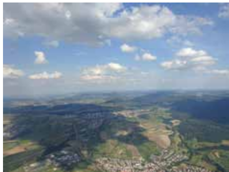
Blick zur Burg Hohenzollern

Drachen- und Gleitschirmfliegerclub Hohenneuffen