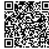
QR-Code Meldeplattform Asiatische Hornisse

Um möglichst rasch Maßnahmen zum Fang der Königinnen und Beseitigung der Nester der Asiatischen Hornisse zu veranlassen, bittet das Ministerium für Umwelt, Klima und Energiewirtschaft um Meldung von Sichtungen in Baden-Württemberg. Dies ist über die Meldeplattform auf der Homepage der Landesanstalt für Umwelt (LUBW), aber auch über die kostenlose „Meine Umwelt-App“ möglich: