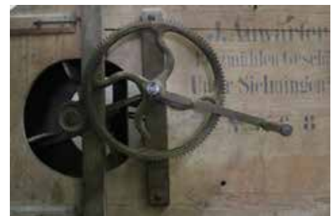
Das Freilichtmuseum Beuren räumt auf. Bei einer Verkaufsaktion am 2. Juni auf