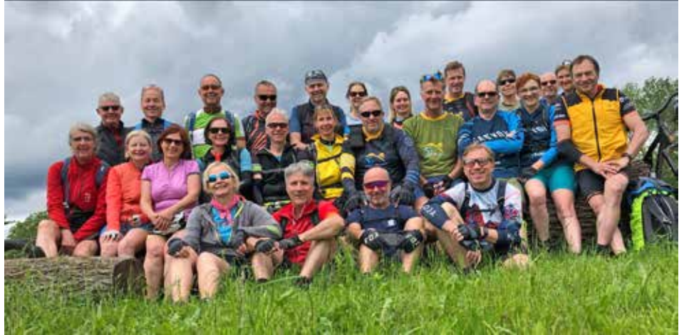
Das Bild zeigt die Gruppe der 42sten Pfingstradtour

ßend ein Eis, bevor es an die restlichen zehn Kilometer ging und wir dann am Abend das Spadi erreichten. Eine wunderschöne Pfingstradtour vom Ursprung der Fils bis zu ihrem Einverleiben in den Neckar, mit vielen schönen landschaftlichen Leckerbissen war am Ende angelangt. Helmut Meyer