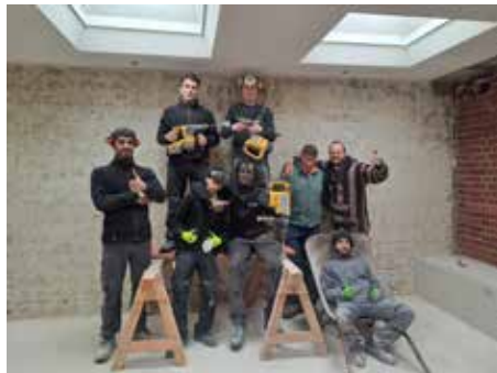
Gruppenbild nach getaner Arbeit