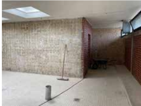
Wände im Rohzustand

abgerissen und viele Quadratmeter Wand von Fliesen befreit . Trotz der widrigen Bedingungen – die Bauweise unserer Kleinschwimmhalle, mit im Dickbett verlegten Fliesen, wurde als sehr stabil attestiert – konnte ein Großteil der WCs im Eingangsbereich, die Herrendusche und das Herren-WC wieder in den Rohbauzustand zurückversetzt werden.