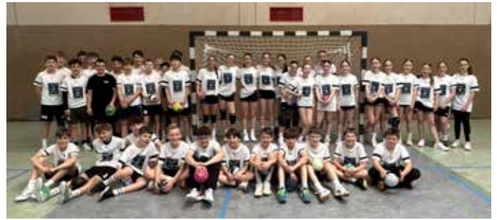
Jahrgänge 2011-2014