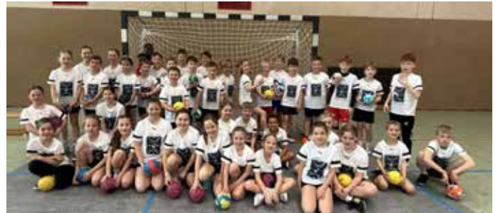
Jahrgänge 2015-2018