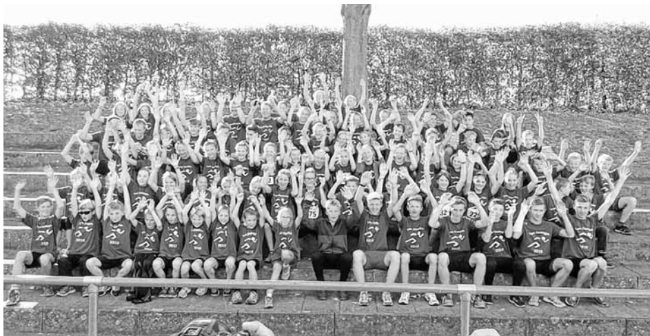
Team Esslingen ...