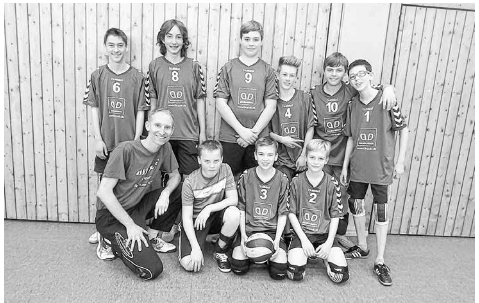
Das Team inkl. stolzem Trainer

Am 24.10. stand der diesjährige Heimspieltag der männlichen U16 Volleyballer des TBN auf dem Programm. Gleichzeitig mit der U20 weiblich veranstalteten wir diesen Spieltag in der städtischen Halle, was zu einem erfreulichen Besucher-Ansturm führte. Getragen von dieser Fan-Kulisse holten unsere Jungs alles aus sich heraus und gewannen beide Spiele jeweils klar mit 2:0. Einmal gegen die TG Nürtingen, gegen die wir vor einigen Wochen noch verloren hatten und dann auch gegen die Georgi Allianz Stuttgart, ein Team das immerhin 2. Bundesliga-Nachwuchs anbietet. Dementsprechend verdattert ob des Neuffener Spielflusses waren dann auch gegnerische Spieler und Trainer, denn den Neuffener Jungs ist zur Zeit jede Trainingswoche anzumerken. Es geht technisch und taktisch sehr gut voran, manche Spieler nutzen auch den gemeinsamen zweiwöchentlichen Trainingstermin zusammen mit der weiblichen U16. Auf diesem Weg auch